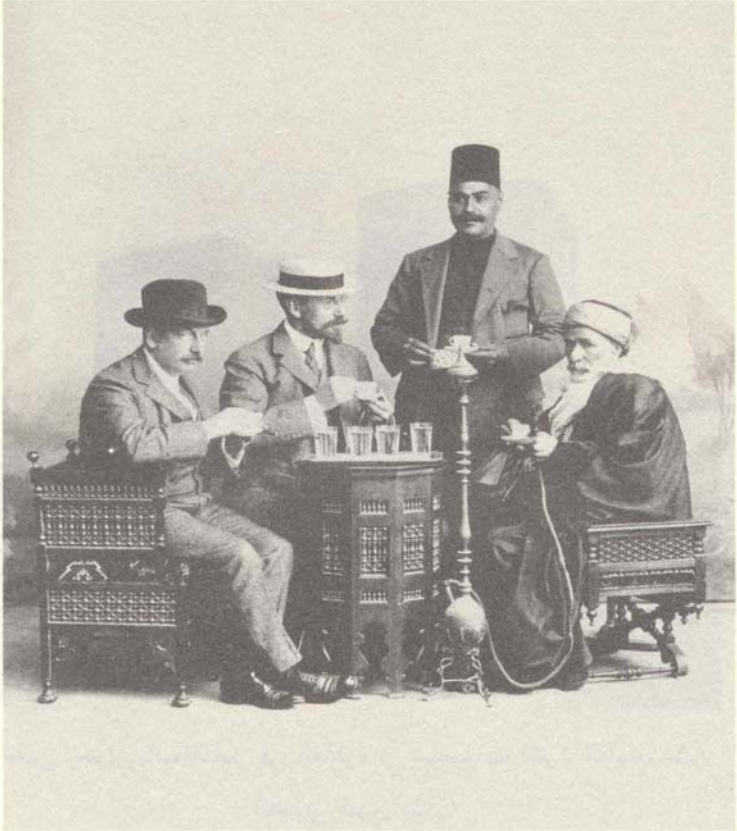
جامع التحف والمخطوطات الأميركية شارل فراير في القاهرة 1907